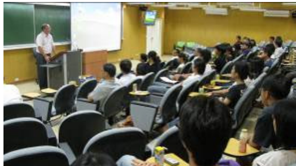
農化系研究生迎新在二館階梯教室由老師上台介紹系所現況

農化系於9月7日(星期二)在本校農化系二館階梯教室及一館系會議室舉辦研究生新生訓練暨迎新活動，希望能舉辦一個歡迎新生的活動，藉此聯絡農化系研究生之間的感情，也可以幫助新生認識臺大、認識農化系。