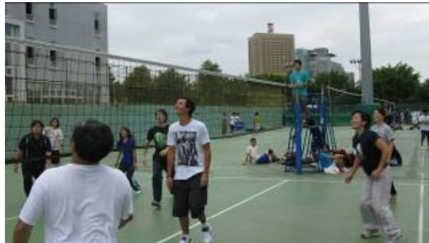
農化系 99 級師生盃排球賽比賽現場

本系系學會為促進本系師生交流並推廣運動風氣，於 99 年 10 月 9 日(星期六) 上午 8:30 舉行「農化系 99 級師生盃排球賽」，增進全系所師生感情交流。其中共有 7 隊伍參賽分別為：教師 1 隊；研究生 2 隊；大學部學生 4 隊。