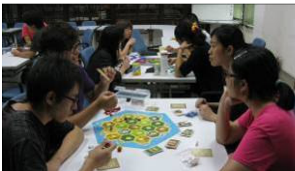
農化系研究生迎新活動藉此分組遊戲輕鬆活動中讓研究生彼此認識