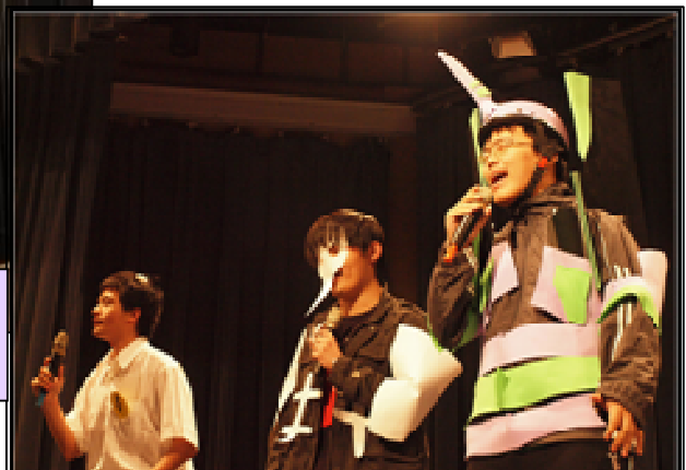
農化系聖誕歌唱大賽師生載歌載舞