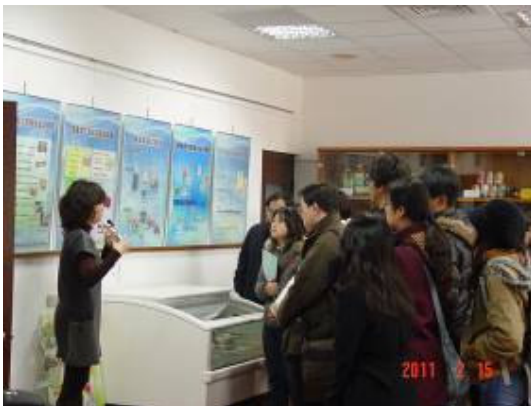
農化系師生參訪新竹食品工業發展研究所人員簡介情形

農化系於民國 100 年 2 月 15 日辦理『研究機構』參觀活動，此次活動將參訪食品工業發展研究所（新竹）與行政院農業委員會茶葉改良場（平鎮）等單位。由農化系教師同仁暨大四以上學生與研究生參加。途中接受各單位招待介紹，了解相關研究機構，參觀教學非常圓滿成功。