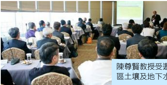
陳尊賢教授受邀籌備及主持”東亞及東南亞地區土壤及地下水污染整治”國際研討會現況