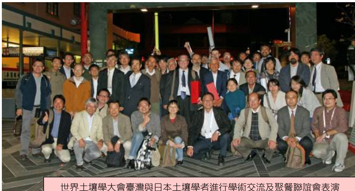
世界土壤學大會臺灣與日本土壤學者進行學術交流及聚餐聯誼會表演