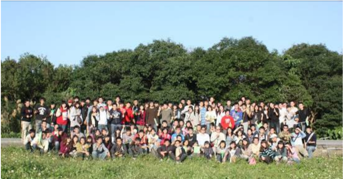
115 位修土壤學課程同學與兩位教授及 6 位助教合影留念