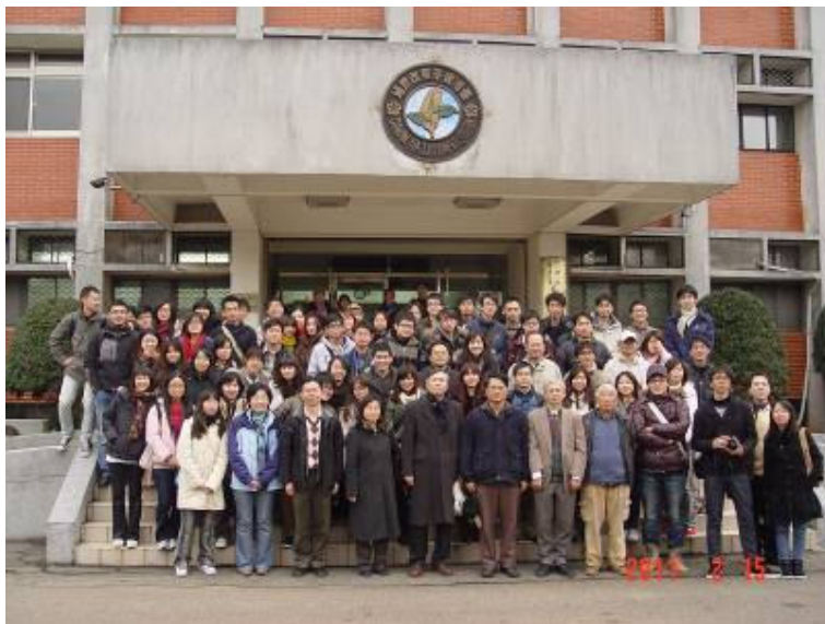
農化系師生於參訪平鎮茶葉改良場合影