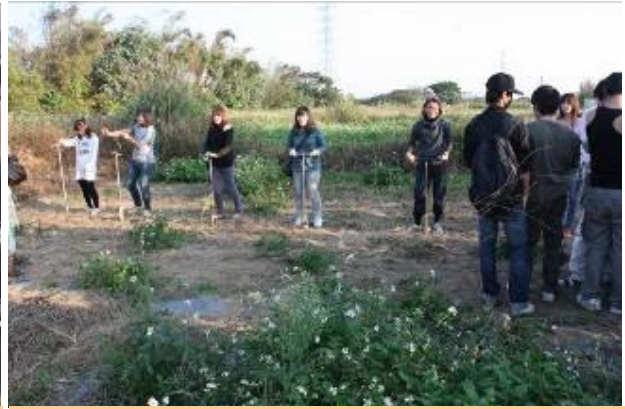
土壤學修課女同學於野外練習以土鑽取土壤樣品