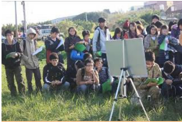
土壤學修課同學在野外聽現場課情形