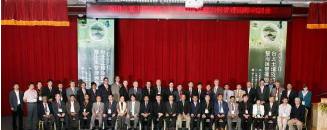
2010 土壤及地下水污染整治國際研討會出席之專家學者共 49 人合影

2010 土壤及地下水污染整治國際研討會於 2010 年 10 月 27 日於本校集思會議中心召開，由台灣環保署土污基管會主辦，臺灣出席代表近 350 人，邀請之國際重要學者及專家共 37 人，總計約 400 人與會參加，共發表近 50 篇論文，主要研討主題包括土壤及地下水污染之各種新穎調查技術的發展、污染物分佈模式的新發展、有機污染物之新整治技術發展，理論發展與現場調查技術之研發等。農化系有陳尊賢教授、李達源教授受邀出席擔任大會演講之主持人。