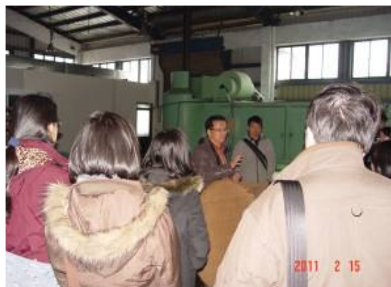
農化系師生參訪茶葉改良場人員講解介紹場區加工設施