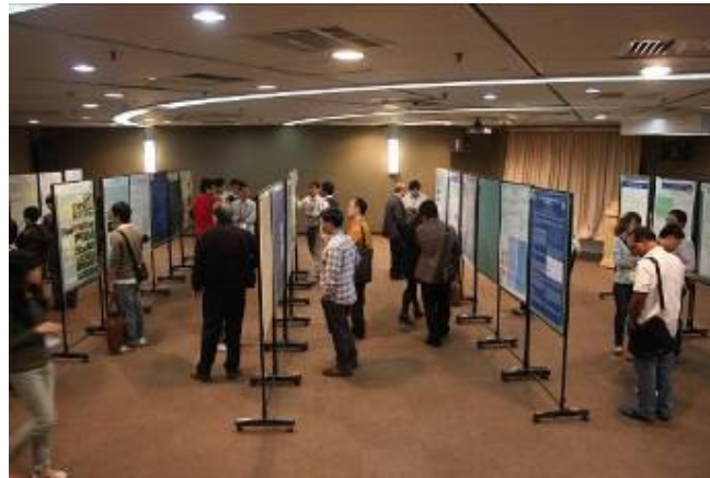
海峽兩岸土壤肥料學術研討會壁報論文展示及討論會場