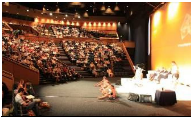
第 19 屆世界土壤學大會開幕典禮及傳統文化表演

第 19 屆世界土壤學大會於 2010 年 8 月 1 日至 6 日於澳大利亞的布里斯本市舉行，共有來自 68 個國家 1914 位土壤專家註冊參加此次大會，大會共邀請八位全職專家出席演講，343 篇口頭報告論文 1227 篇壁報論文。參加本屆世界土壤大會的臺灣學者有 16 位，包括本院農化系李達源、陳尊賢、王明光等三位教授與其博士班研究生多位及森林系鄭智馨老師，以及幾位台大溪頭實驗林研究員，分別參加長榮或華航的套裝行程前往澳洲布里斯本。