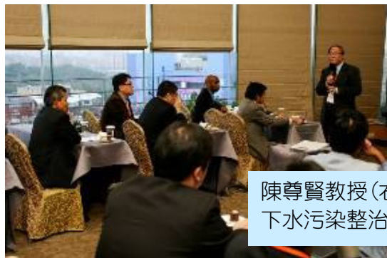
陳尊賢教授(右一)於”東亞及東南亞地區土壤及地下水污染整治”國際研討會作總結