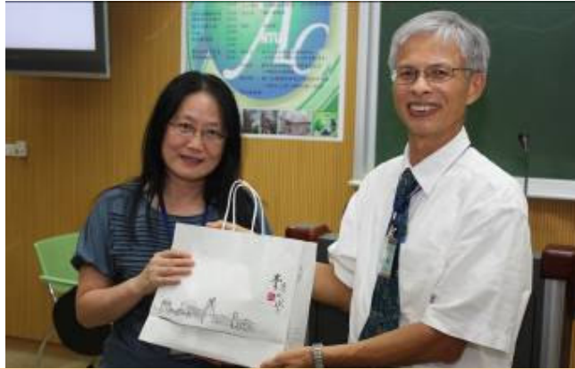
新生暨家長懇親座談會系主任致贈系友黃雪莉教授紀念品