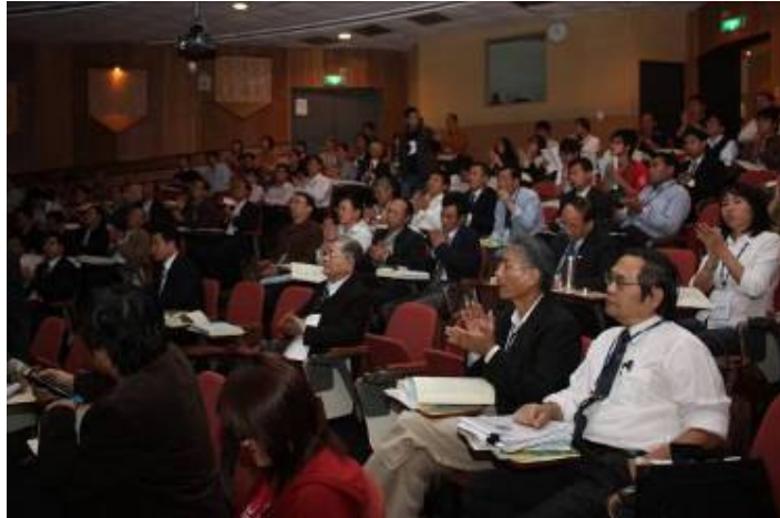
海峽兩岸土壤肥料學術研討會會場一角，參加人員熱烈參與