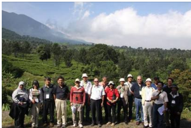
亞洲土壤碳吸存國際研討會會後土壤碳含量考察